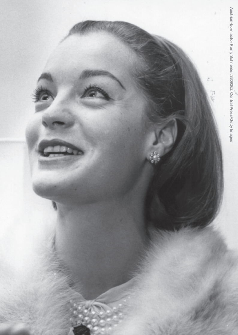
Austrian-born actor Romy Schneider; 3309262