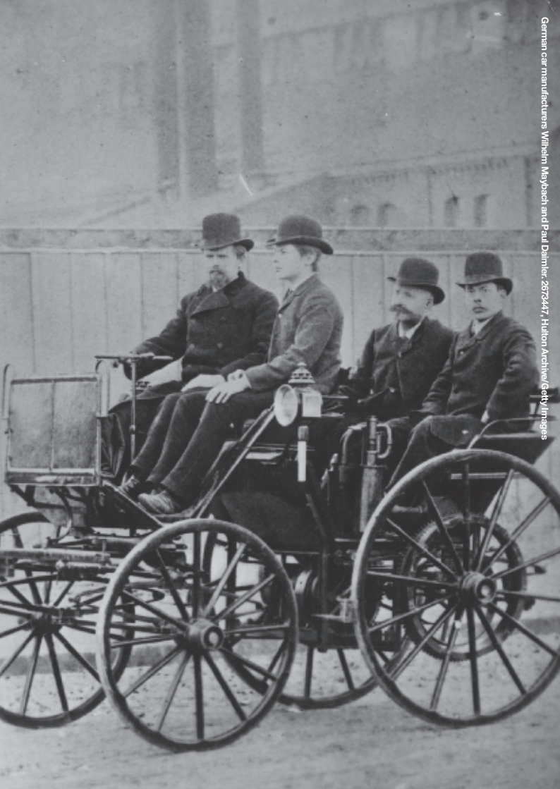
German car manufacturers Wilhelm Maybach and Paul Daimler, 25/24/7